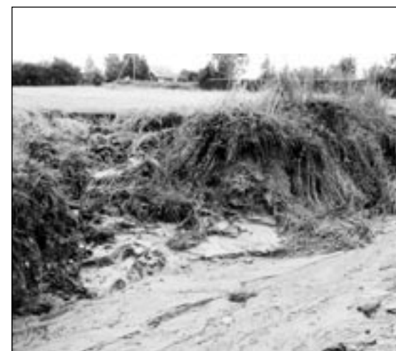
Po sierpniowych ulewach powiatowa droga na ulicy Górki była nieprzejezdna.